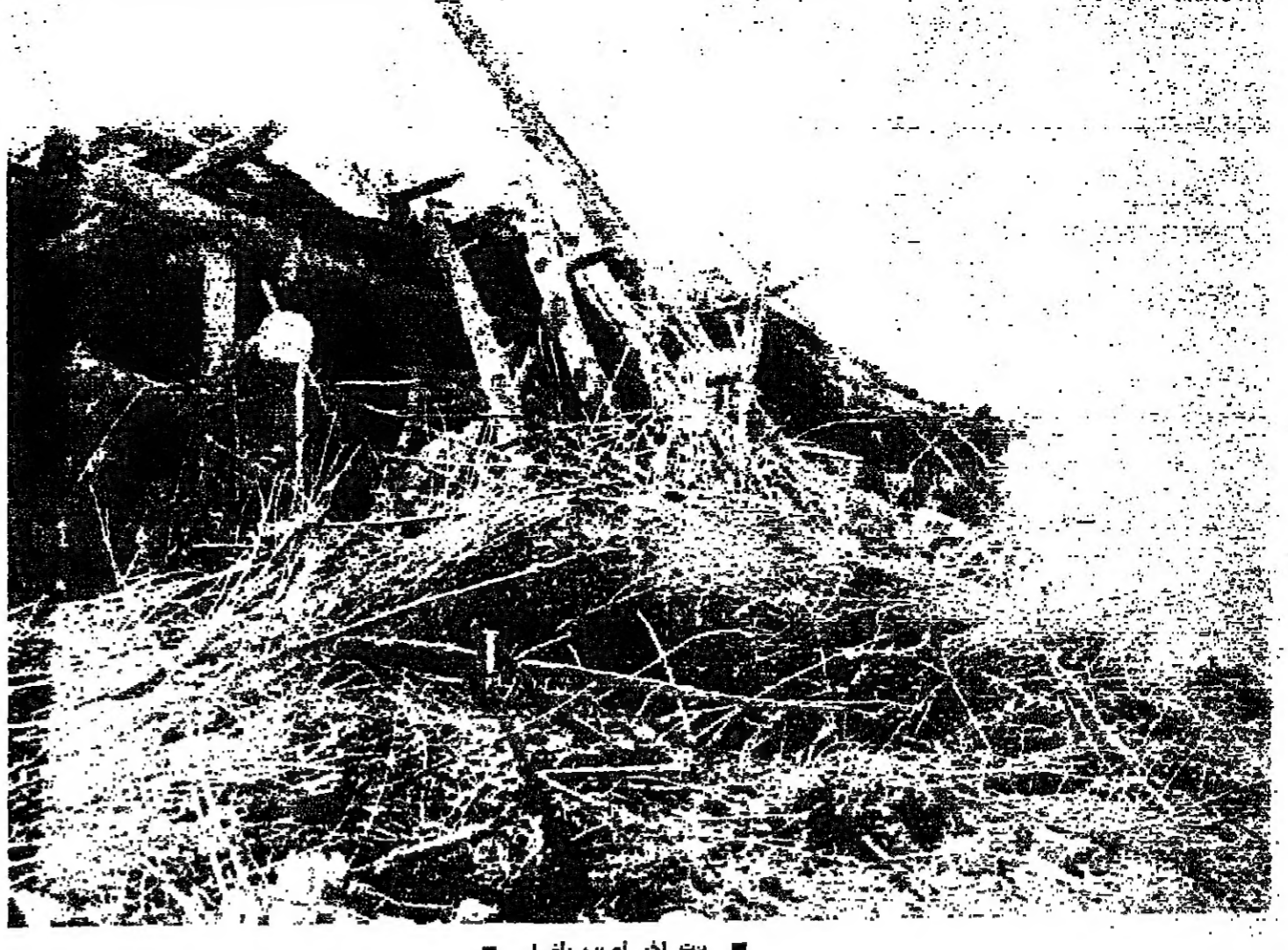
بيت اضر اصيب بضرار

طرابلس - من مكتب «الاتوار» : ظهر احد الرماة صباح امس ، على جثة امرأة مجهولة الهوية ، على شفة النهج الكبير في عكار ، وهي مصابة بثلاث طلقات نارية في راسها وصدرها وفخذها . ونقل الرامي الخبر الى رجال الدرك والتالي قتلها .